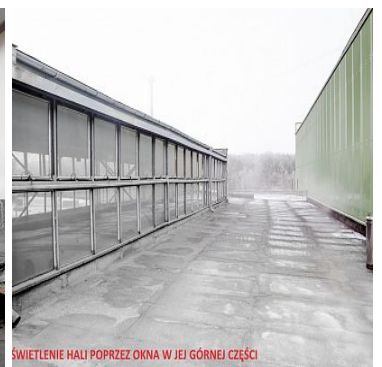
ŚWIETLENIE HALI POPRZEC OKNA W JEJ GÓRNEJ CZĘŚCI

Produkcyjna hala z możliwością powieszenia suwnicy 5 tonowej na istniejącym w hali torze suwnicowym. Obiekt do wynajmu w odległości 30 km od Szczecina. Dostępność od zaraz. Hala magazynowo-produkcyjna ogrzewana, o powierzchni 2300m 2 . Do dyspozycji jest również duży plac. Podłoże hali przystosowane do dużych nacisków. Duża moc prądu dociągnięta do hali. W obiekcie jest możliwość zainstalowania suwnic o udźwigu gwarantowanym co najmniej 5 T - udźwig (do sprawdzenia większe udźwigi toru suwnicowego). Hala wyposażona w dwie bramy wjazdowe. Świetliki, oraz dodatkowe okna boczne w niektórych sektorach hal umożliwiają pracę w dzień bez konieczności stosowania sztucznego oświetlenia. Wysokość obiektu wynosi 6-8m. Koszt najmu 15 PLN netto/m 2 +media. Możliwość wykonania podłogi bezpyłowej (czas wykonania 2 m-ce), wtedy czynsz najmu hali wynosić będzie 15,50 pln netto/m 2 . Do czynszu najmu dochodzą media wg. zużycia najemcy, natomiast co