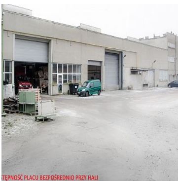
DOSTĘPNOŚĆ PLACU BEZPOŚREDNIO PRZY HALI