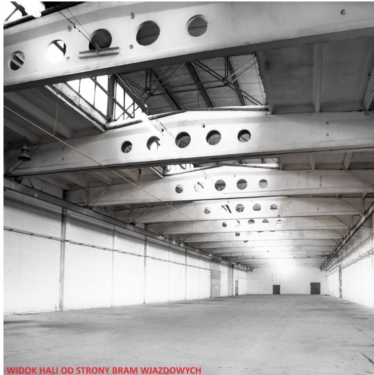
WIDOK HALI OD STRONY BRAM WJAZDOWYCH